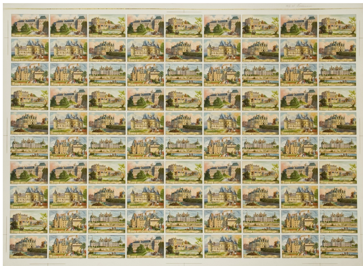
Foglio di stampa della serie di 6 figurine I CASTELLI DELLA LOIRA, 1933, Pubblicità Liebig, Londra, Comune di Modena, Museo della Figurina - FONDAZIONE MODENA ARTI VISIVE

Il percorso intende far comprendere come la storia delle immagini si relazioni con le invenzioni tecniche che ne hanno consentito una sempre maggiore riproducibilità. In particolare, utilizzando specifici pannelli didattici, si approfondirà la cromolitografia, tecnica di stampa strettamente legata alla nascita della figurina e che da metà Ottocento ha reso possibile la diffusione massiva delle immagini stampate. Il principio della stampa sarà inoltre sperimentato in laboratorio dove, attraverso una tecnica di incisione, gli studenti potranno costruire una matrice e creare copie multiple della stessa immagine.