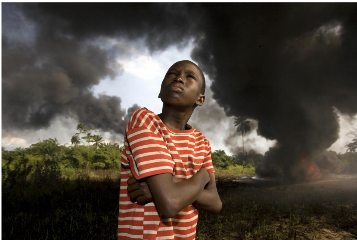
George Osodi, Ogoni Boy, 2007, stampa inkjet, Collezione Fondazione Cassa di Risparmio di Modena - FONDAZIONE MODENA ARTI VISIVE

Quello del ritratto è un genere che da sempre ha caratterizzato la storia dell'arte, ma che con l'invenzione della fotografia ha raggiunto nuovi modelli di rappresentazione. Il percorso presenta una serie di opere di artisti che hanno trattato questo tema, ripercorrendo la storia della fotografia e sottolineando come questa tecnica abbia contribuito a trasformare la visione della società negli ultimi due secoli.